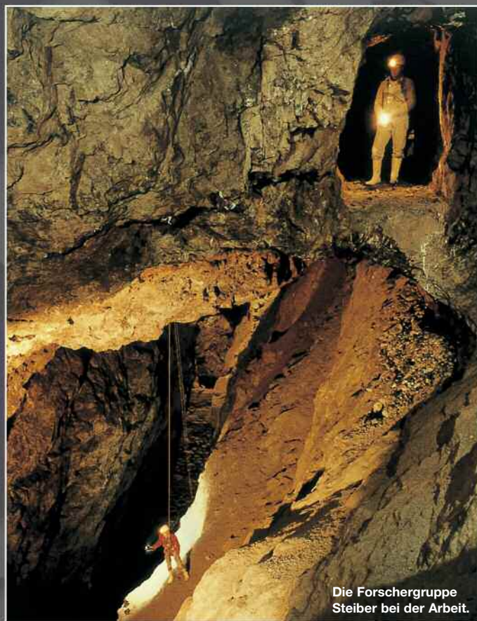
Die Forschergruppe Steiber bei der Arbeit.

Sind Sie neugierig geworden? Wir freuen uns auf Sie als neues Mitglied! Unser Verein ist gemeinnützig, der jährliche Förderbeitrag beträgt 50 €. Darüber erhalten Sie eine Spendenbescheinigung.